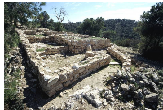
Το Ανατολικό Συγκρότημα, από τα δυτικά.

Λαμβάνοντας υπ' όψιν την θέση, την έκταση και την λειτουργία της ακρόπολης, σε συνδυασμό με τις μαρτυρίες για τις θαλάσσιες επικοινωνίες και τις εξωτερικές σχέσεις της, η μείζων Μυκηναϊκή οικιστική εγκατάσταση των Κανακίων μπορεί να ταυτισθεί με την “αρχαία πόλη”, δηλαδή την παλαιότερη πρωτεύουσα της νήσου, που αναφέρεται από τον γεωγράφο Στράβωνα (IX 1.9), αλλά και σε επιγραφή του ύστερου 1ου αι. π.Χ. από την Ακρόπολη των Αθηνών. Πρόκειται για την πρωτεύουσα του ναυτικού βασιλείου της Σαλαμίνας, γνωστού από την επική παράδοση, την έδρα της δυναστείας των Αιακιδών και του Τελαμωνίου Αϊαντος, και μητροπόλη της Σαλαμίνας της Κύπρου (με πρώτο οικιστή τον Τεύκρο).