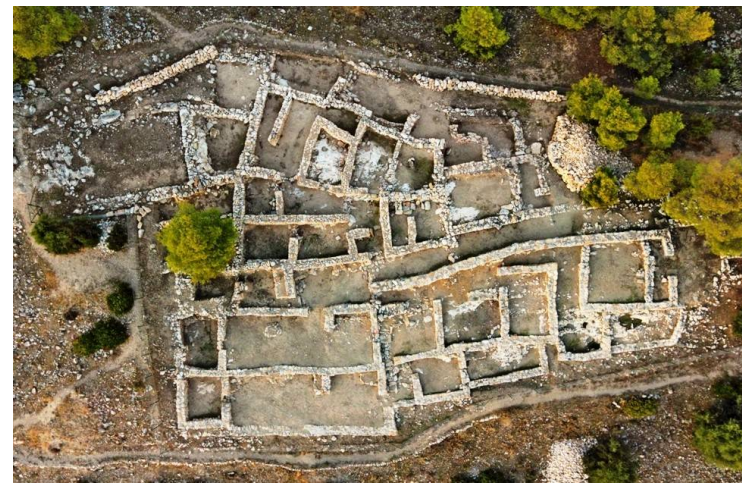
Το κεντρικό Κτήριο Γ με το διδυμο μέγαρο.

Stone spindle whorls, of Cypriot-Neareastern type (13th – early 12th century B.C.).