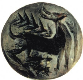
Ανατολικό Συγκρότημα. Σφραγιδόλιθος από στεατίτη με παράσταση ελαφιού ή αντιλόπης ανάμεσα σε φυτικά μοτίβα.

Building Gamma. Fragment of copper ox-hide ingot, from Cyprus (Late 13th—beginning of 12th century B.C.).