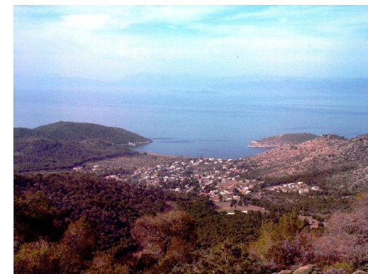
Ο Όρμος των Κανακίων από τα ανατολικά. The Bay of Kanakia, from the east.