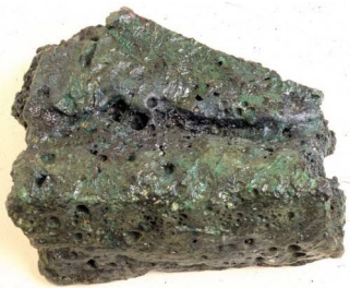
Κτήριο Γ. Τμήμα Κυπριακού ταλάντου χαλκού (Υστερος 13ος—αρχές 12ου αι. π.Χ.).

Building Gamma. Fragment of copper ox-hide ingot, from Cyprus (Late 13th—beginning of 12th century B.C.).