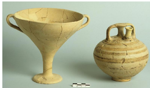
Ανατολικό Συγκρότημα Χαρακτηριστικά πήλινα αγγεία: κύλιξ και μικρός ψευδόστομος αμφορέας (13ος-αρχές 12ου αι. π.Χ.).

Εύρημα εντελώς μοναδικό, με ευρύτερες προεκτάσεις, από την ανασκαφή, είναι ένα χάλκινο έλασμα από φολιδωτή πανοπλία Ανατολικού τύπου, σφραγισμέ-