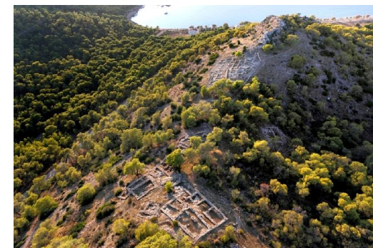
Κανάκια. Αεροφωτογραφία της Μυκηναϊκής ακρόπολης, με τα ανασκαμμένα κτήρια, στα ανώτερα επίπεδα (από τα ανατολικά).

Kanakia. Aerial photo of the Mycenaean acropolis, with the excavated buildings, on the upper terraces (from the east).