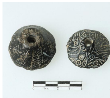
Λίθινα σφονδύλια, Κυπριακού ή Ανατολικού τύπου. (13ος – πρώιμος 12ος αι. π.Χ.).

Stone spindle whorls, of Cypriot-Neareastern type (13th – early 12th century B.C.).