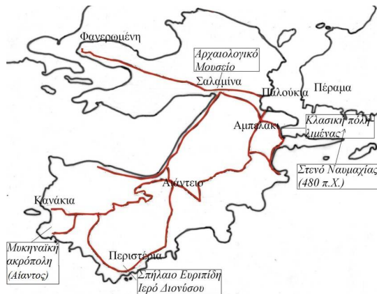
Χάρτης Σαλαμίνας, με τις προσβάσεις στους αρχαιολογικούς χώρους.

Building Delta. Coarse ware stirrup jar, with two parallel incisions (certainly post-firing) on one handle. (13th—beginning of 12th century B.C.).