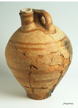
Κτήριο Δ. Μεγάλος Μυκηναϊκός ψευδόστομος αμφορέας του εμπορικού τύπου, με δύο παράλληλες εγχαραξίες (μετά την όπτηση) στη μία λαβή (13ος—αρχές 12ου αι. π.Χ.).

Eastern Building Complex. Steatite seal stone, with a representation of a deer or antelope among floral motifs.