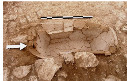
Κτήριο Γ. Πήλινος λουτήρας (ασάμινθος) ενσωματωμένος στο δάπεδο του προθαλάμου της βορείας εισόδου.

The Eastern Building Complex, from the west.