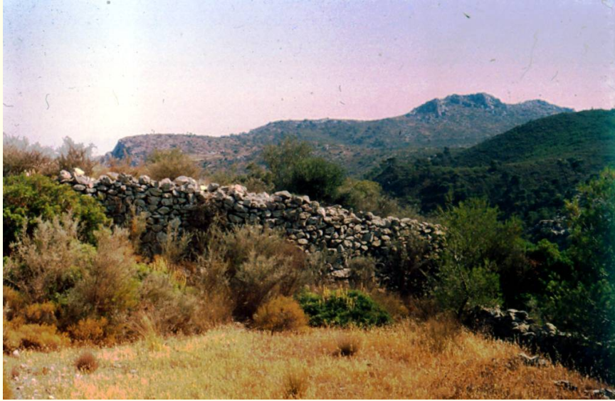
Γκίνανι, Ακρόπολη Α. Βόρειο τμήμα του οχυρωματικού περιβόλου, από τα βόρεια.