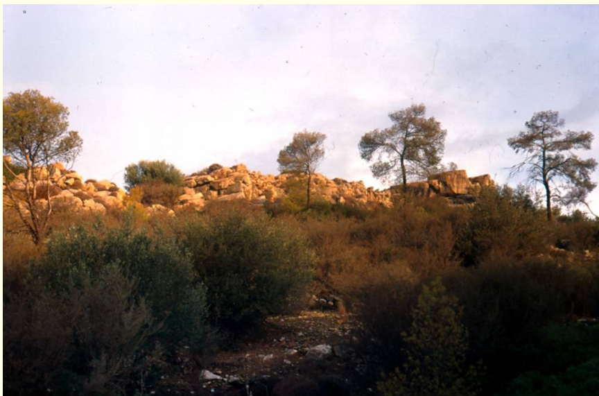
Γκίνανι, Ακρόπολη Α. Άποψη της ακρόπολης, από τα ανατολικά.