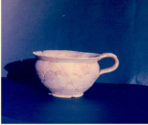
Γκίνανι, Ακρόπολη Α. Μόνωτο κύπελλο Ύστερων Γεωμετρικών χρόνων από κτίσμα εντός του περιβόλου.