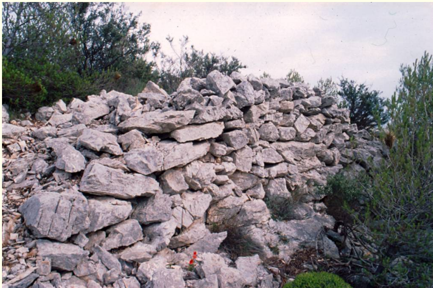
Γκίνανι, Ακρόπολη Β. Δυτικό τμήμα του οχυρωματικού περιβόλου, από τα βορειοδυτικά.