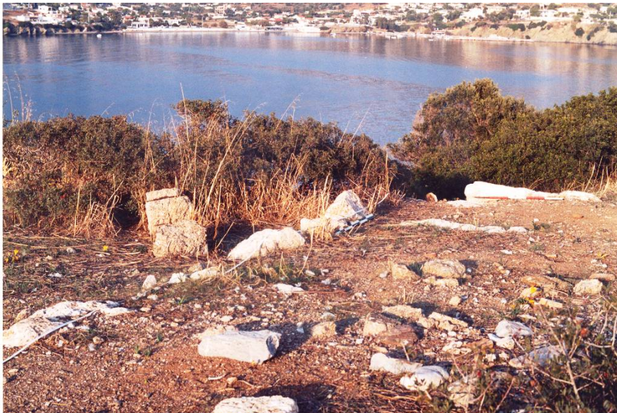
Θεμελίωση αρχαίου ορθογωνίου πύργου (του 4 ου αι. π.Χ.) στο κορυφαίο τμήμα της βραχονησίδας.